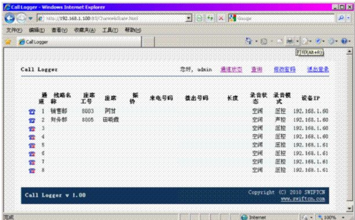
WEB 界面（此为选件，需要另外收费）